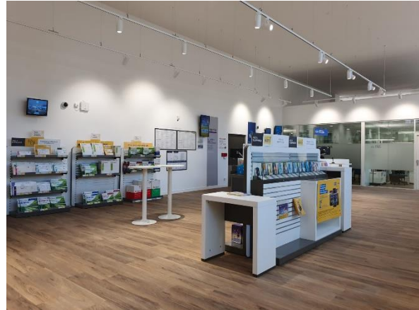
Après travaux

Chaque année, près de 400 bureaux de poste sont modernisés sur l'ensemble du territoire.