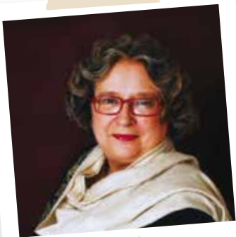
L'invitée d'honneur Catherine Clément

Née dans une famille mi-catholique, mi-juive, Catherine Clément passe une grande partie de son enfance sur les bords de la Loire avec sa grand-mère chrétienne, ce qu'elle raconte dans Maison mère (éditions Nil, 2006). La guerre l'a privée de ses grands-parents juifs, dénoncés, déportés et morts à Auschwitz en mai 1944.