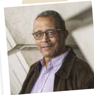
Le parrain Yasmina Khadra