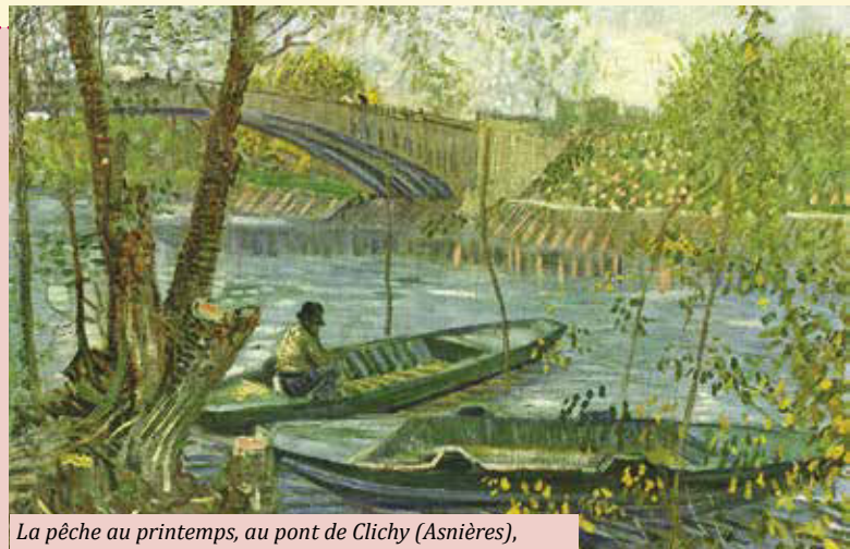
La pêche au printemps, au pont de Clichy (Asnières), Vincent Van Gogh, huile sur toile, Chicago, Art Institute.

du square par l'entrée de la rue du Château et jeter un œil au château d'Asnières !